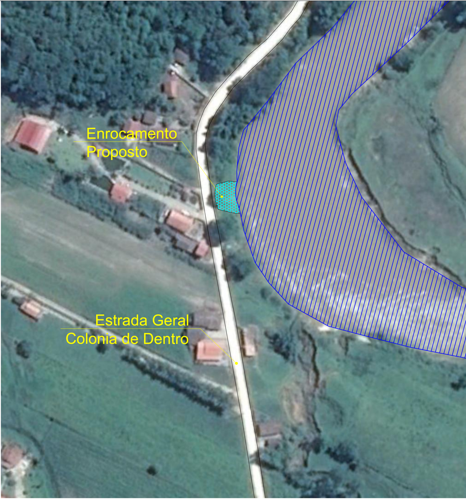
PLANTA DE LOCALIZAÇÃO Sem Escala