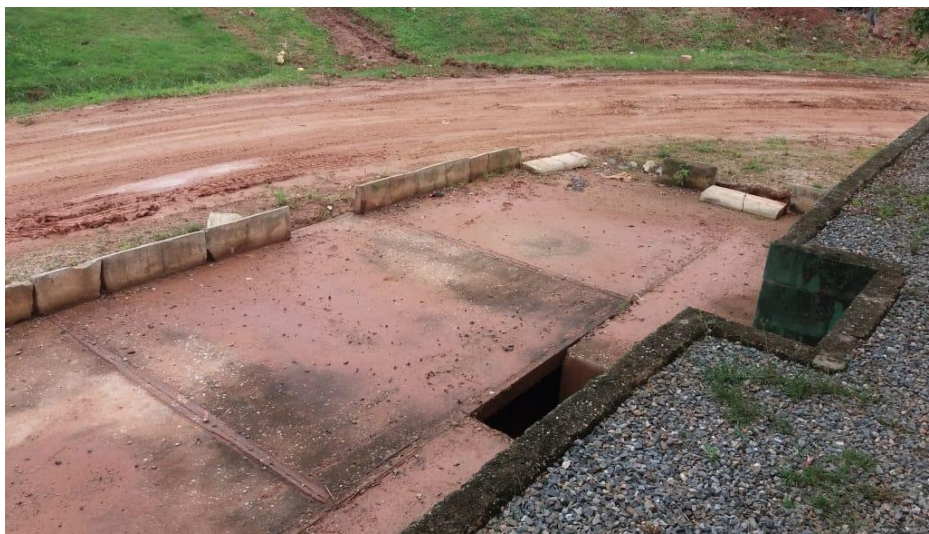
Situação atual da balança rodoviária para pesagem e controle dos resíduos (Apenas Estrutura).

O operador de balança poderá ser substituído por vigilante no período noturno, sendo que este deverá ainda monitorar a área do aterro impedindo a entrada de pessoas estranhas, animais e veículos, anotando os fatos extraordinários em registro próprio para conhecimento da supervisão dos serviços.