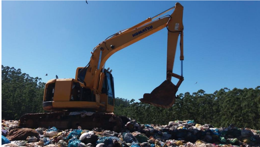
Nivelamento e compactação da atual frente de serviço