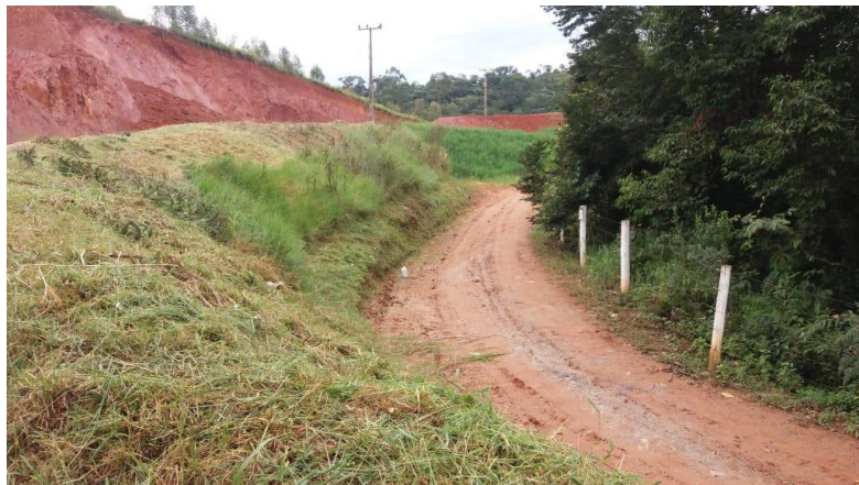
Vista lateral dos acessos internos (em direção ao antigo galpão de reciclagem)

Os acessos e a frente de serviço deverão estar em condições de operação para que mesmo em dias de constantes chuvas seja possível o trânsito de caminhões.