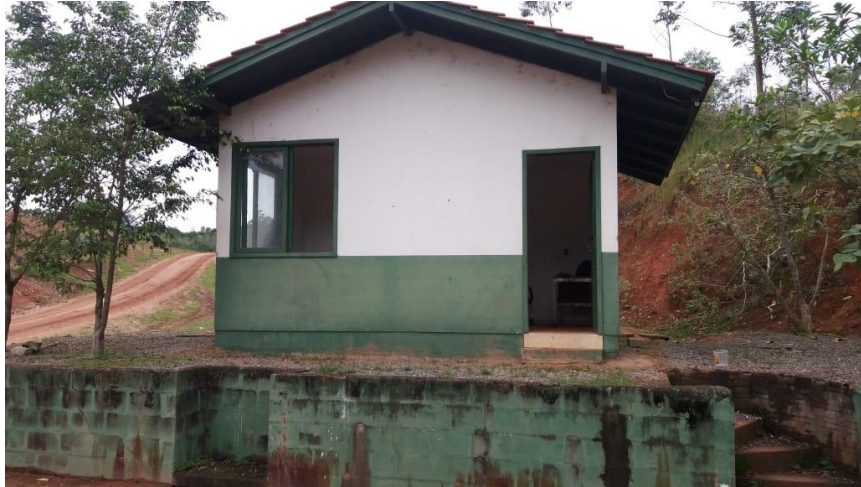
Vista frontal da guarita, localizada na entrada do aterro