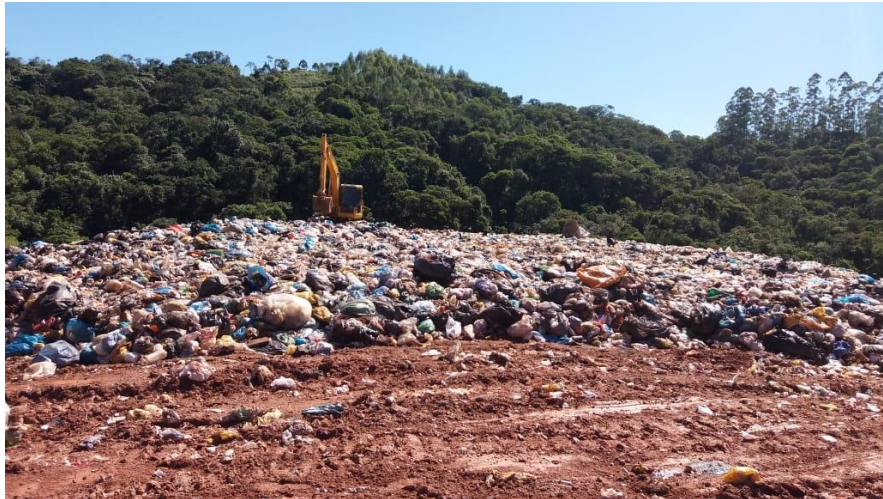
Vista frontal de avanço da frente de serviço

Sempre que houver a necessidade da saída de um equipamento em operação da frente de serviço suas esteiras deverão ser limpas e eventuais resíduos carreados deverão ser recolhidos.