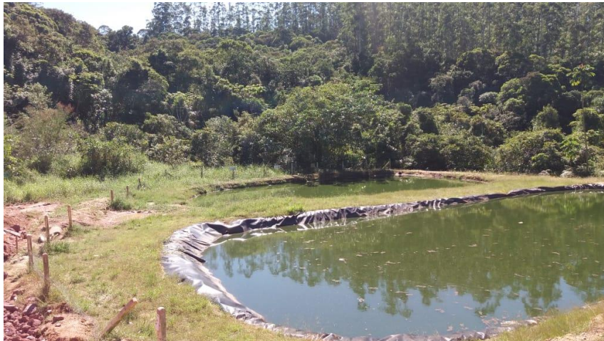
Lagoa 02 – “Aeróbia” e ao fundo a terceira lagoa, denominada de Maturação

Caso a Concessionária receba resíduos de outros Municípios, para se adequar aos padrões exigidos pela legislação ambiental e futuras condicionantes, o sistema de tratamento de efluentes deverá ser ampliado e modernizado a fim de atender a demanda de efluente gerado.