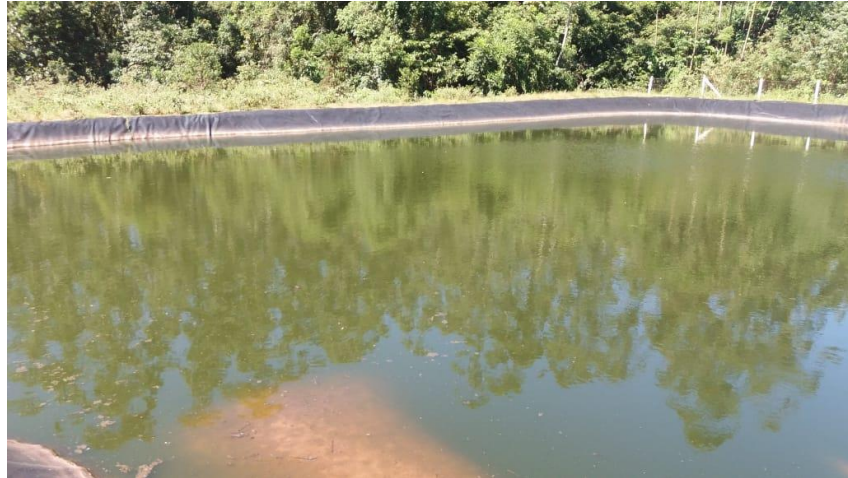
Lagoa 01 – entrada “Anaeróbia”.