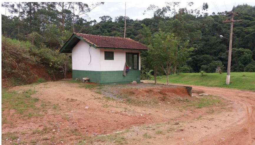
Vista lateral da guarita, localizada na entrada do aterro