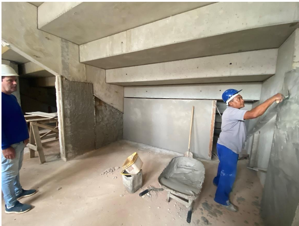
Figura 19 - Execução da nova alvenaria, chapisco e reboco