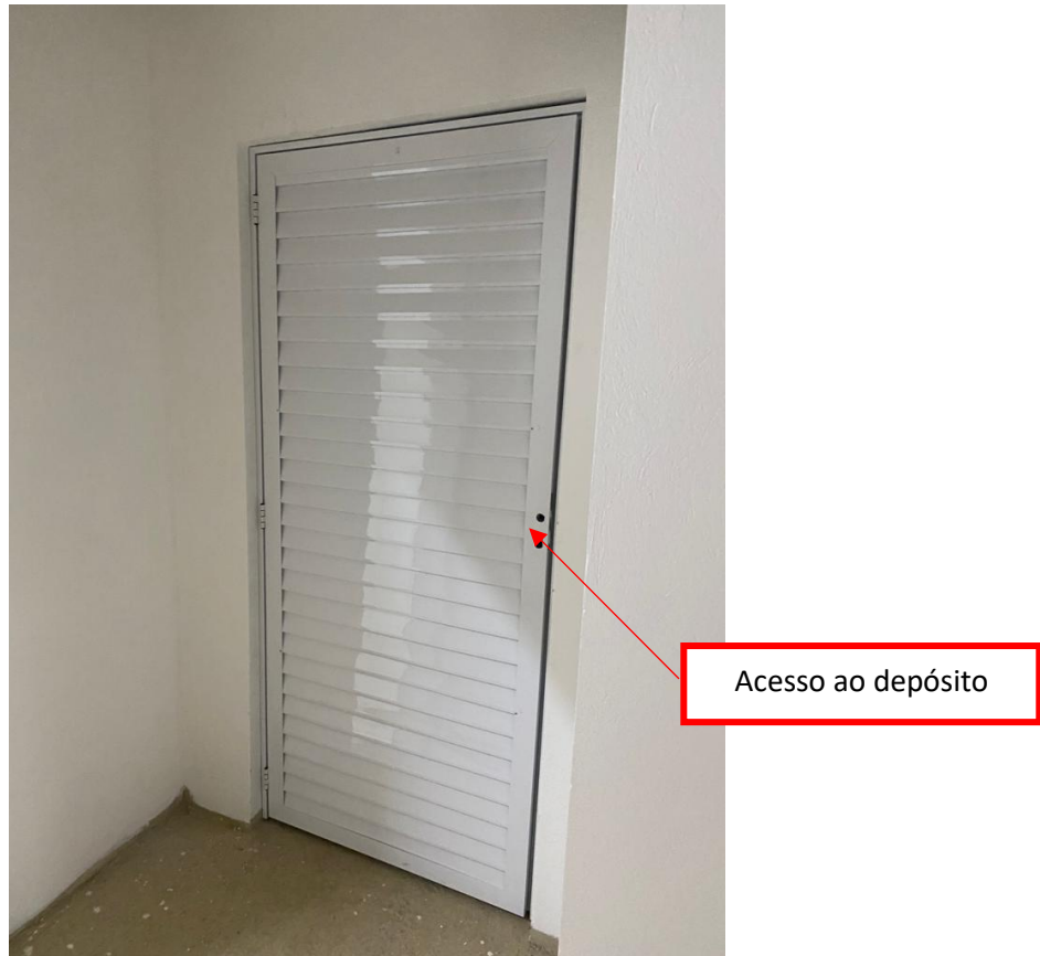
Figura 10 - Porta de Acesso ao depósito abaixo da arquibancada