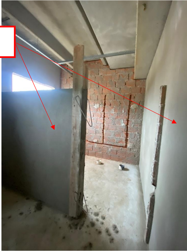
Figura 16 - Definição de paredes a demolir