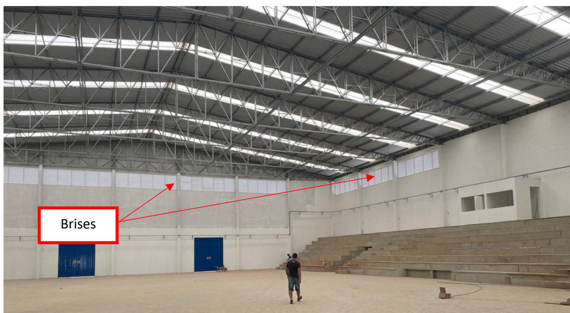
Figura 9 - Brise em Alumínio