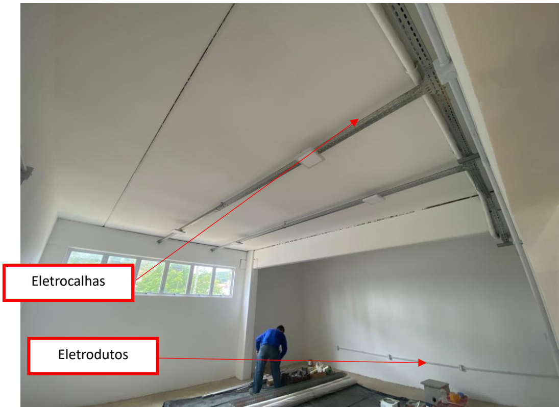
Figura 11 - Instalações elétricas aparentes