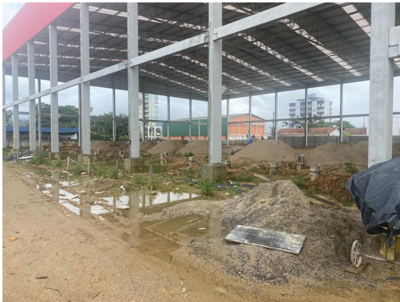
Figura 3 - Execução de Aterro

No projeto inicial não estava contemplada a execução de aterro para edificação. Entretanto, o terreno encontrava-se em nível abaixo da via, o que fez com que houvesse a necessidade de execução de aterro, para que o nível final do piso do ginásio, ficasse acima do nível da rua.