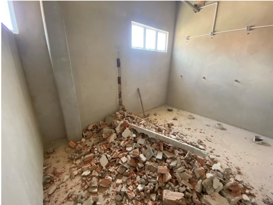
Figura 18 - Demolição das paredes