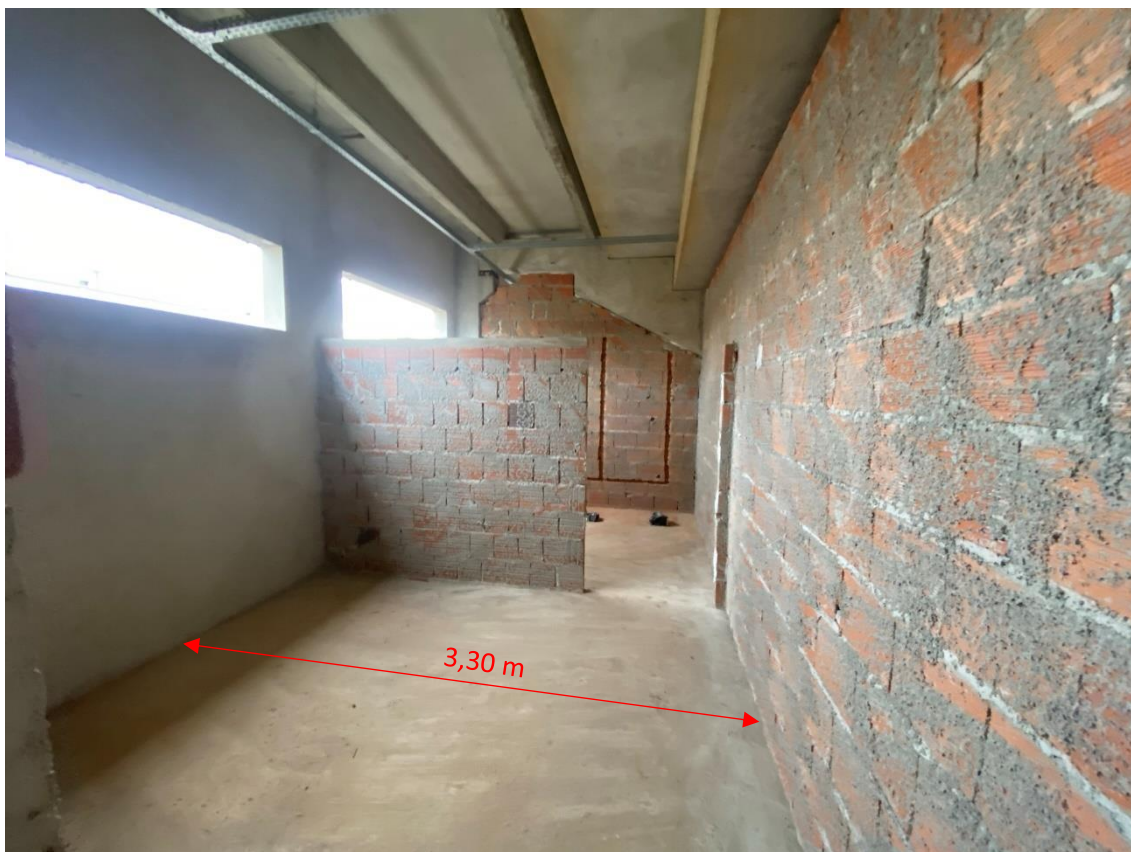
Figura 15 - Vestiários conforme projeto licitado

Para essa melhoria foi necessário a demolição das paredes executadas, aumento da área de assentamento do piso cerâmico, aumento da área de alvenaria, chapisco e reboco. Como mencionado, esses serviços foram realizados sem ônus à Prefeitura Municipal, devido a compensação resultante da alteração das dimensões do piso.