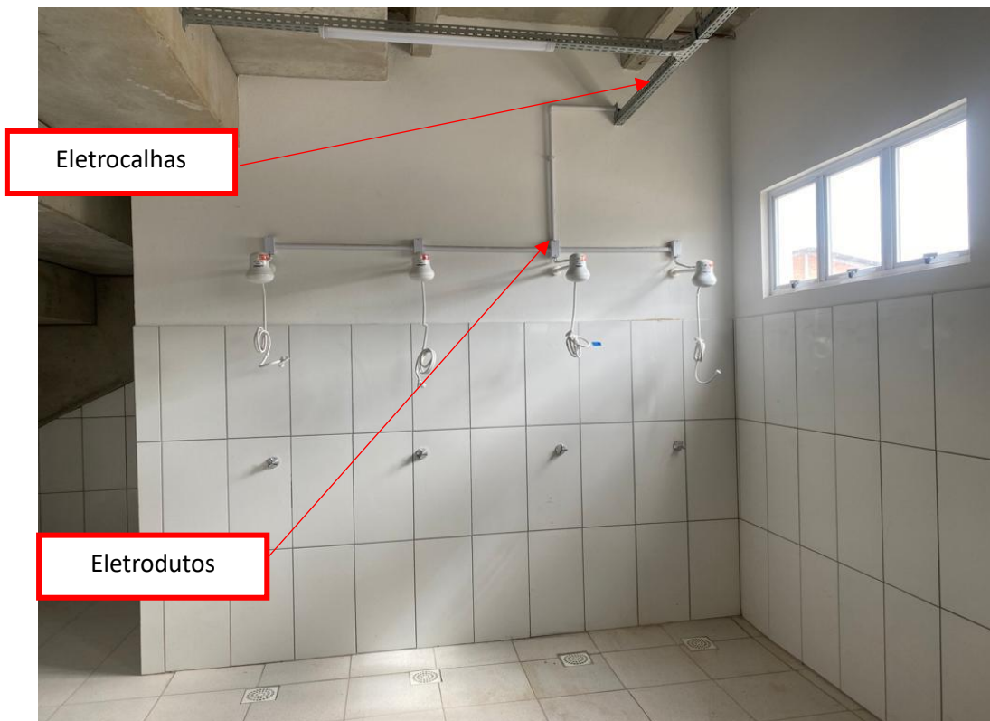
Figura 12 - Instalações elétricas aparentes