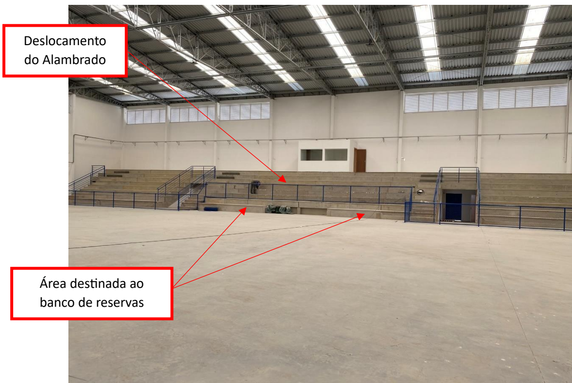
Figura 14 - Deslocamento do alambrado e criação do espaço para banco de reservas

Esta alteração estava prevista para ocorrer após a entrega da obra. Entretanto, foi possível realizar a alteração anterior à finalização da obra, devido a uma compensação financeira em relação ao piso cerâmico implantado.