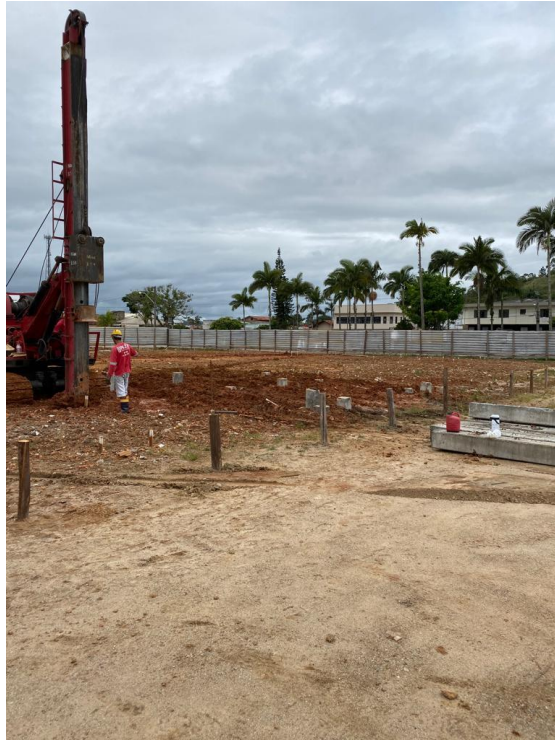
Figura 2 - Cravação de estacas pré moldadas