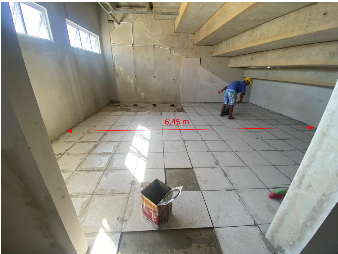
Figura 21 - Vestiários 02 e 03 após melhoria