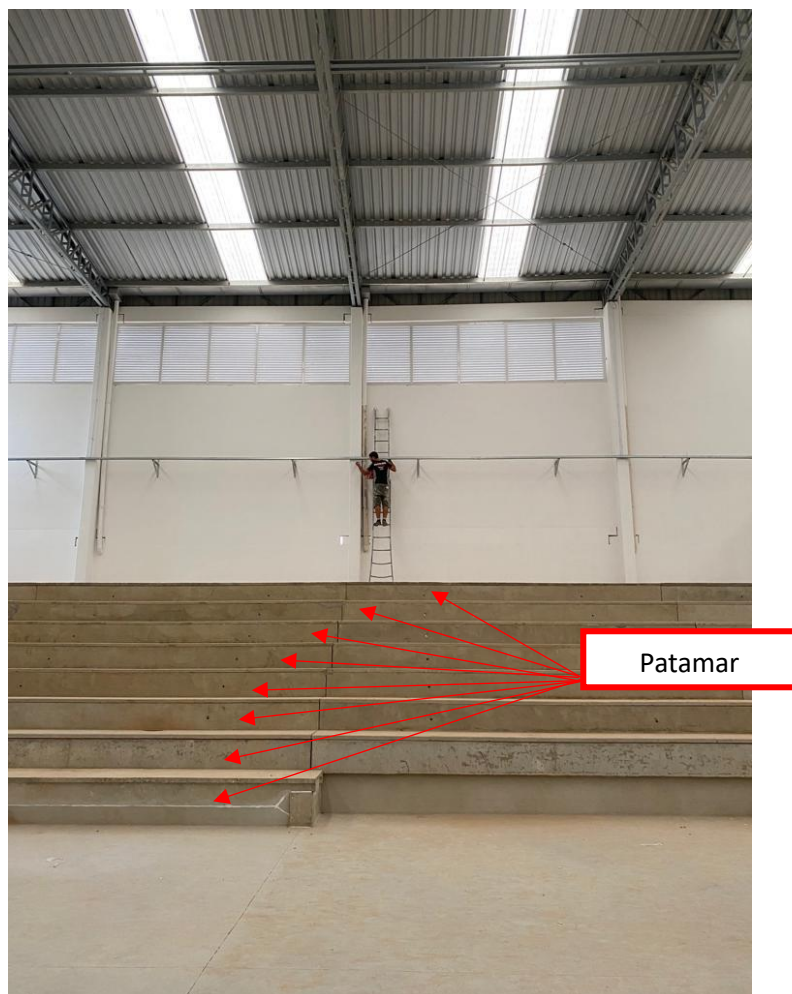
Figura 6 - Arquibancada com 8 patamares

Para garantir o pé-direito (altura) nos banheiros e vestiários abaixo das arquibancadas foi necessário que as arquibancadas fossem compostas por oito patamares ao invés de sete. Devido a esta alteração houve um avanço da arquibancada no nível da quadra, sendo reduzido, portanto, a área de escape lateral.