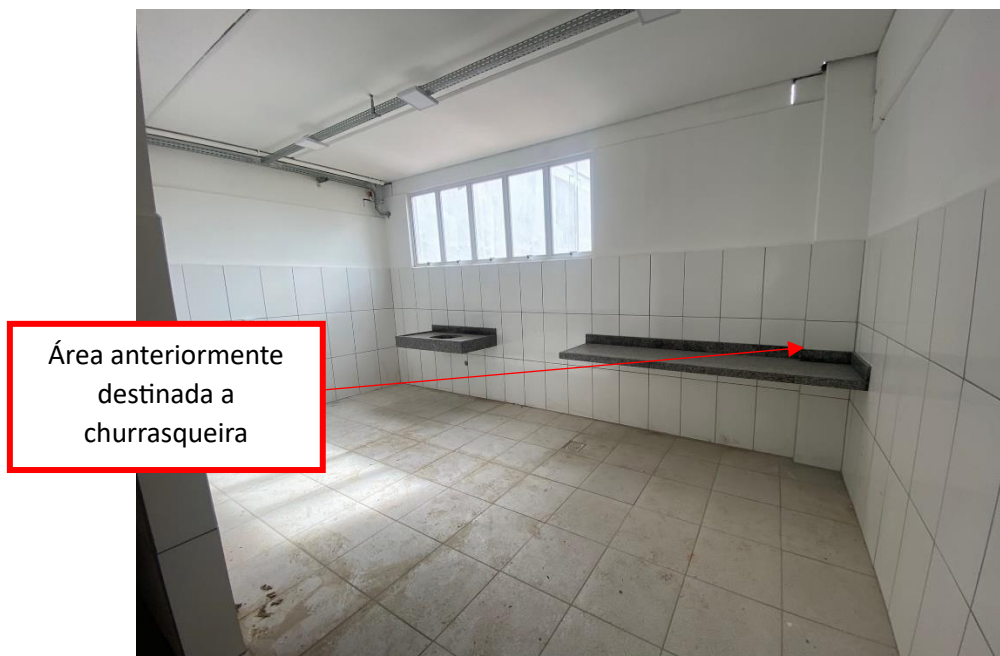
Figura 13 - Remoção da Churrasqueira

Conforme determinação da administração municipal, não deveria ser executada a churrasqueira prevista na área de lanchonete como indicado em projeto, e a mesma passou a ser área destinada a bancada.