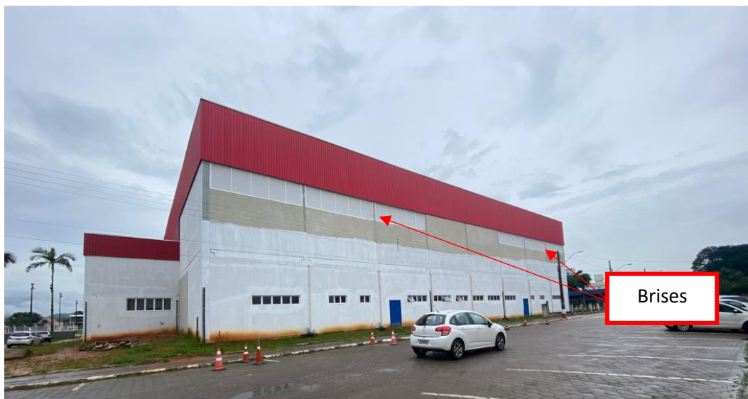
Figura 8 - Brise em Alumínio