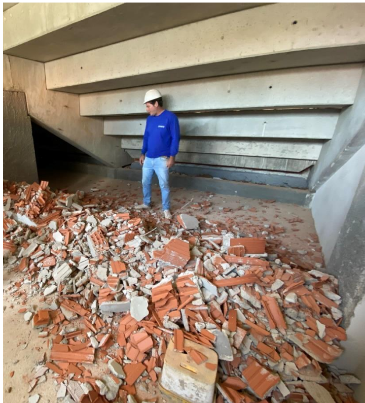
Figura 17 - Demolição das paredes