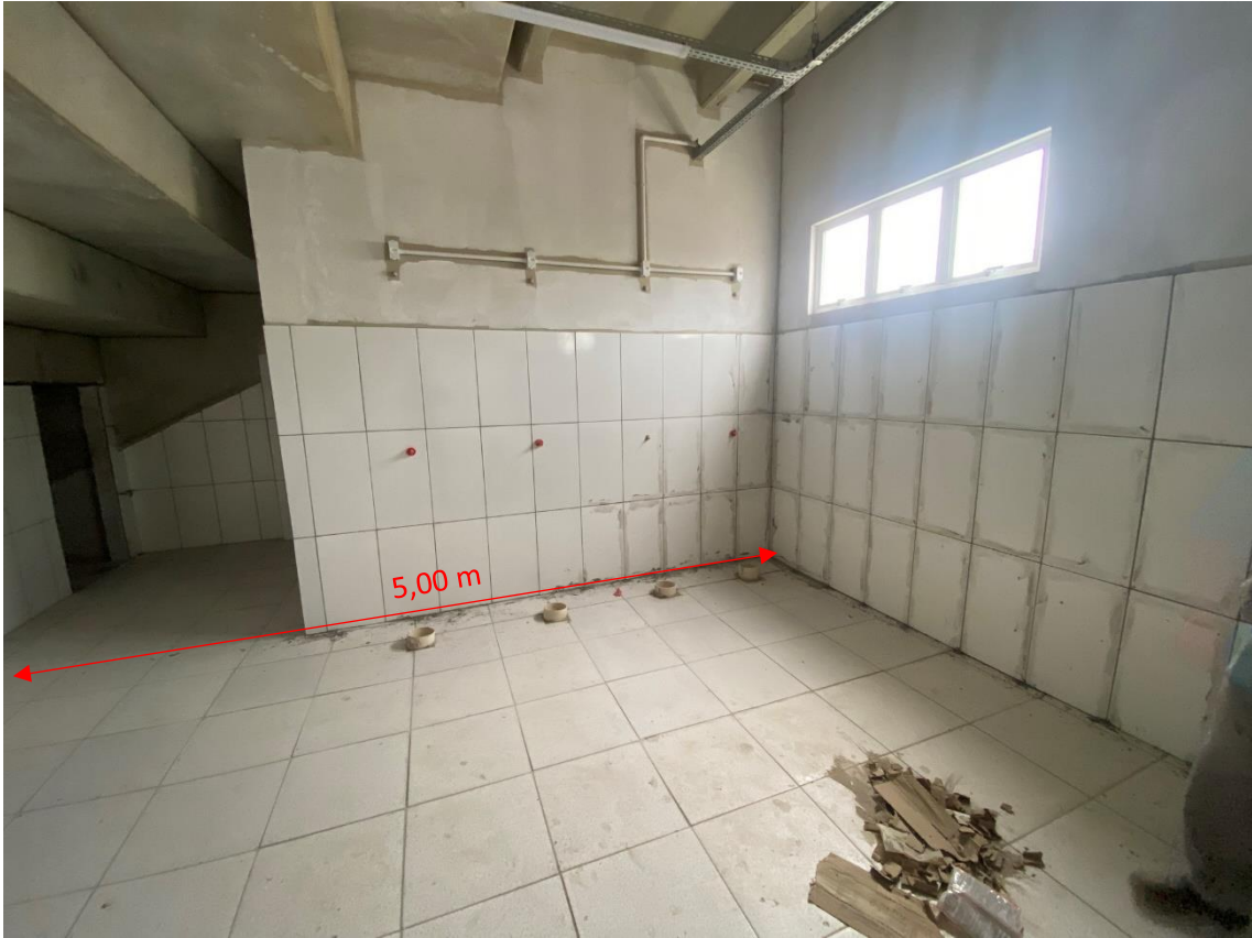
Figura 20 - Vestiários 01 e 04 após a melhoria