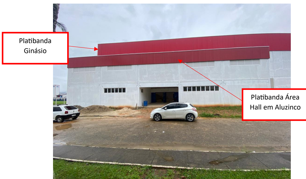
Figura 7 - Platibanda em aluzinco no hall

Por solicitação da Prefeitura Municipal de São João Batista, visando o embelezamento da obra, foi alterada a platibanda do hall para utilização de telhas em aluzinco pintadas em vermelho, seguindo o padrão da platibanda do ginásio.