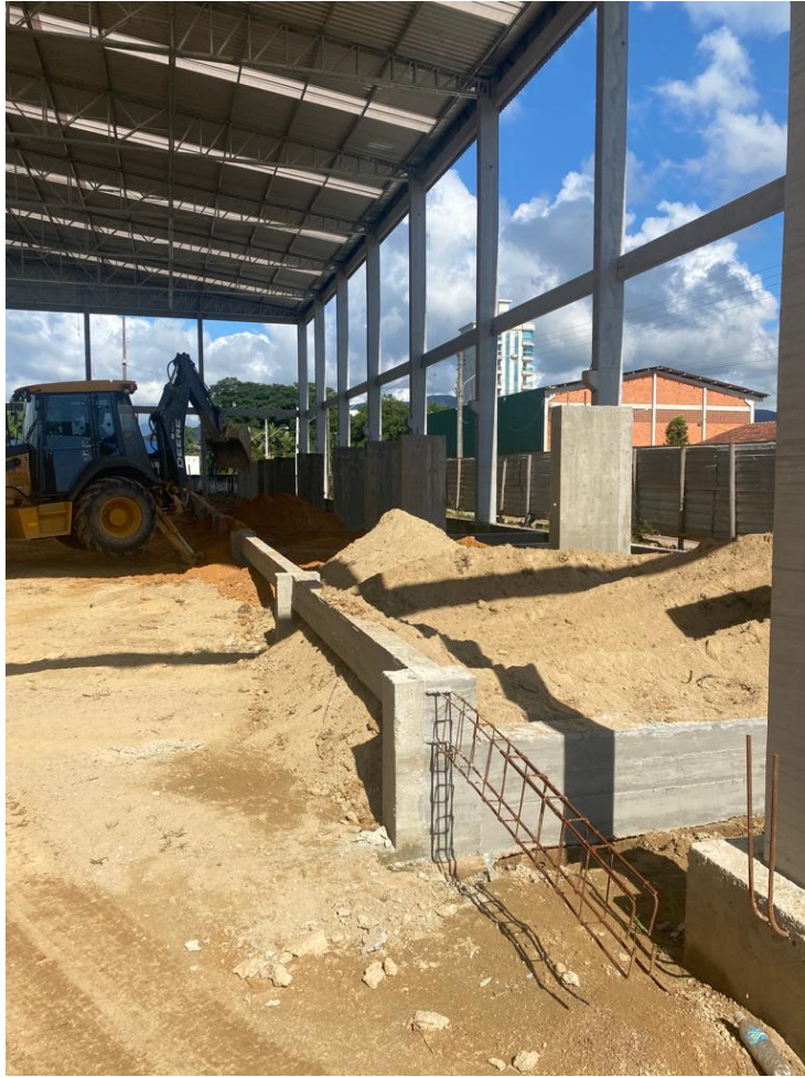
Figura 4 - Execução de Aterro