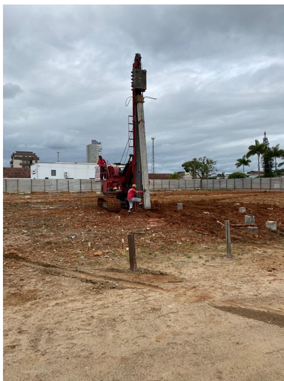
Figura 1 - Cravação de estacas pré moldadas

Por esse motivo foi alterado o método executivo para cravação de estacas pré-moldadas, uma vez que o maquinário para cravação de estacas encontrava-se disponível para início imediato da obra.